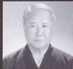
松山隆雄 (重要無形文化財保持者(総合認定))